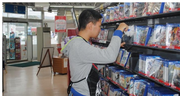
CD/DVDレンタル店での商品整理

将来、地域で働き生活できる力を養うことを目的に、生徒の実態に応じ、職業自立を目指した体験的な学習や、将来の社会生活を考慮した各教科の学習などのカリキュラムにより教育活動を行っています。