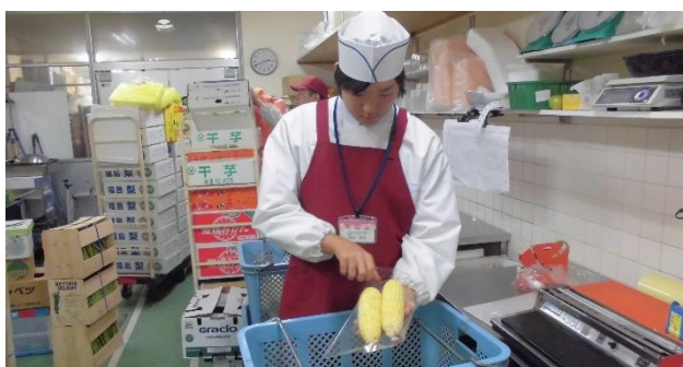
スーパーバックヤードでの農産物の袋詰め

現場実習は、卒業後の職業生活に必要な実際の知識や態度、技術・技能に触れることが可能になると同時に、自らの職業適性や将来設計について考える機会になるなど、将来の社会参加に向け貴重な体験になります。