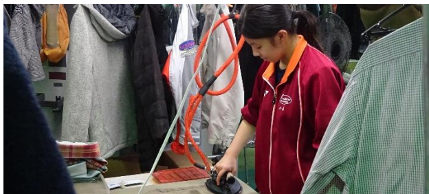
クリーニング工場でのアイロンがけ

職業学科 では、週10時間の作業学習や労働週間などに加え、現場実習を通し働くことに関する学習を計画的に進めています。